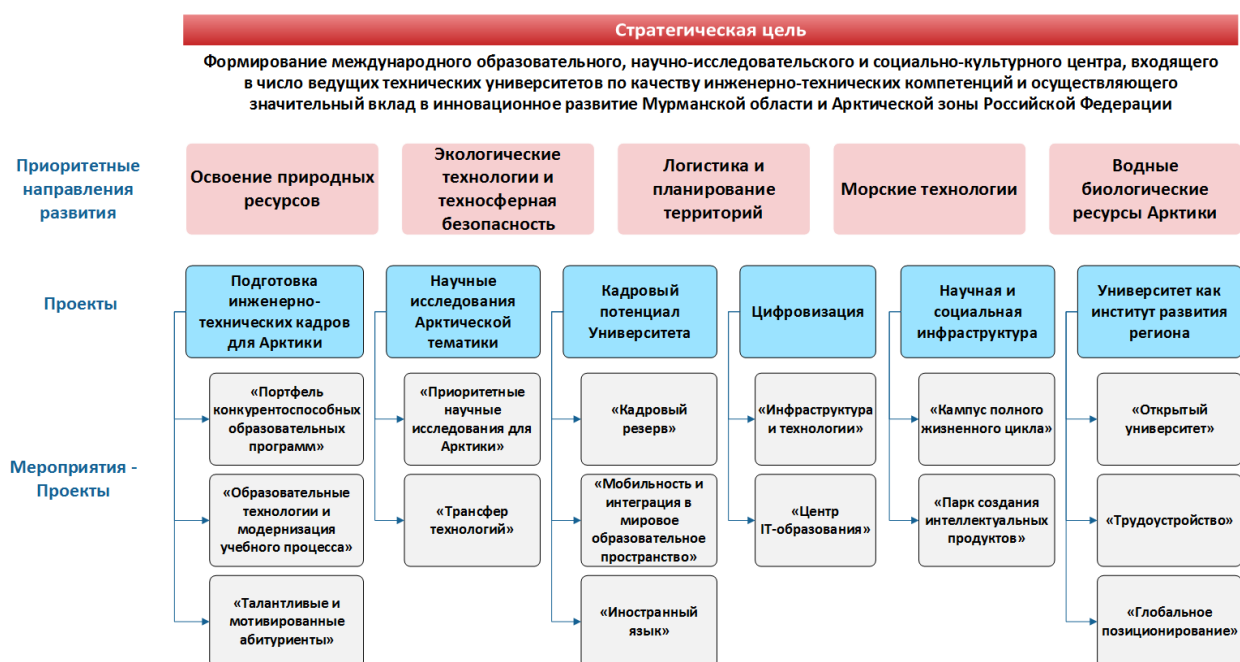
Рис. 2. Программа преобразований по приоритетным направлениям развития Университета. Проектный принцип